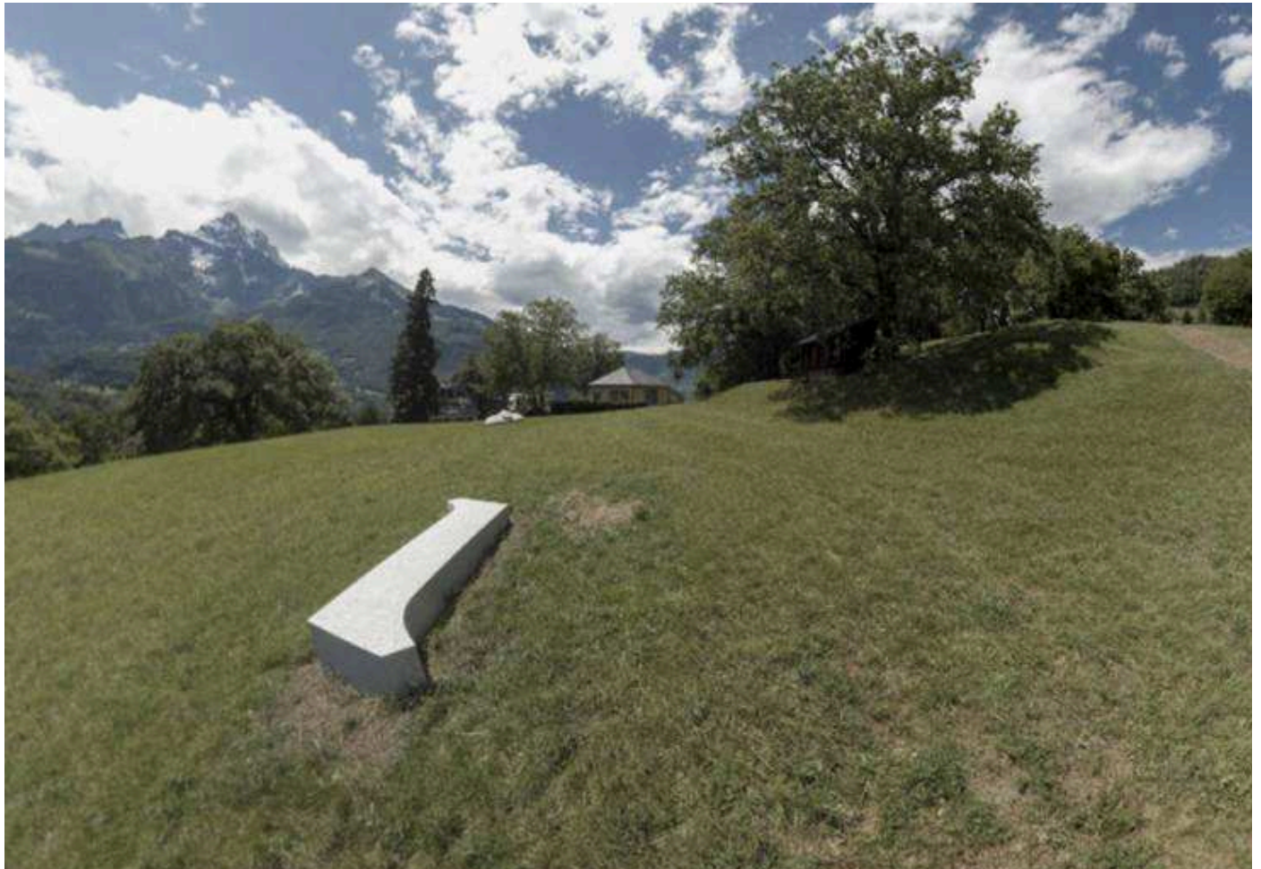
Le turet d'Alice - Rivaz